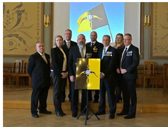
Kuopion Reserviläiset ry:n hallitus

Juhlavassa tilaisuudessa kuultiin juhlapuheiden lisäksi sotilasmusiikkia ilmavoimien soittokunnan toimesta. Juhlan aikana palkittiin ansioituneita Kuopion Reserviläisiä, kuin myös läheisen yhteistyöjärjestön, KRU:n jäsenistöä. Juhlan loppuksi nautittiin juhlakahvituksesta ja toistemme seurasta.