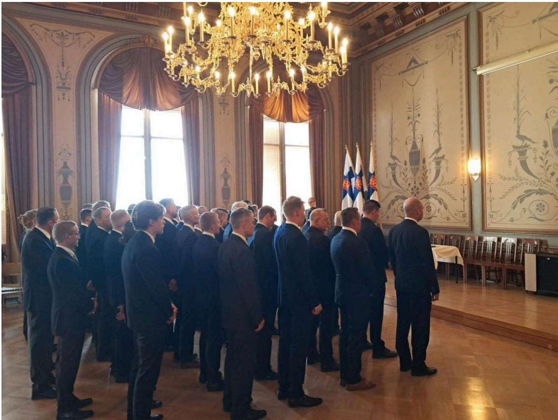
Ylennetyt reserviläiset kuuntelivat aluepäällikön puheenvuoroa Kuopion kaupungintalon juhlasalissa