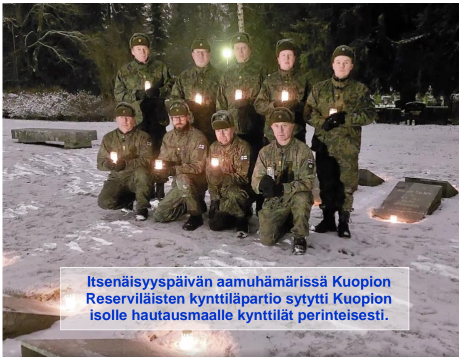
Itsenäisyyspäivän aamuhämärissä Kuopion Reserviläisten kynttiläpartio sytytti Kuopion isolle hautausmaalle kynttilät perinteisesti.