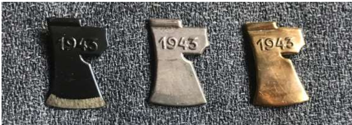
Kuvassa vuoden 1943 rauta,- hopea,- ja kultakirveet.

rautakirves = yksi motti, hopeakirves = neljän mottia, kultakirves = 16 mottia. suurkirves = 48 mottia mestarikirves = 100 mottia.