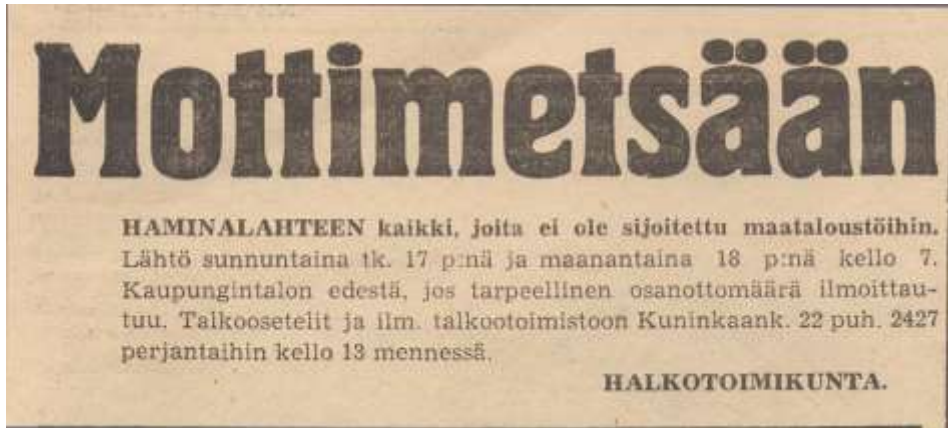
Savon Sanomien ilmoitus mottitalkoista.

Vuonna 1943 jopa kolmasosa Suomen asutuskeskusten tarvitsemasta polttopuusta hakattiin mottitalkoissa.